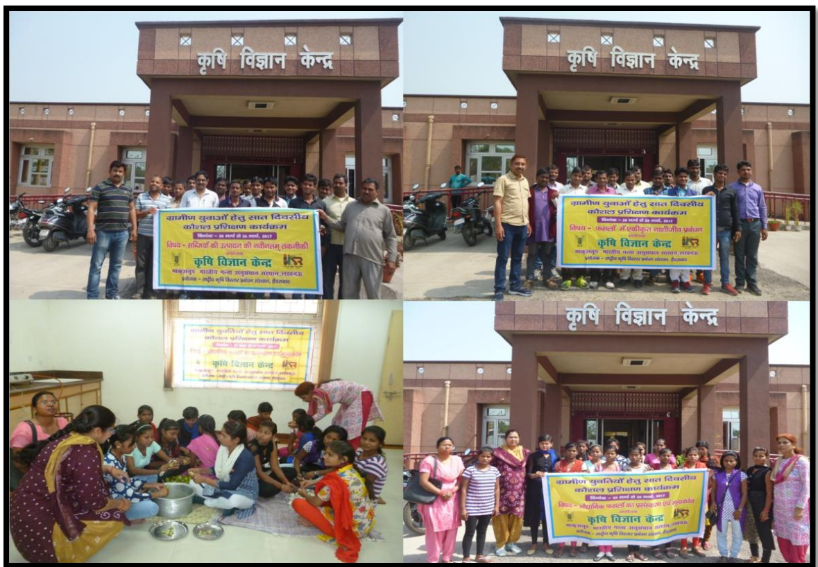
ग्रामीण युवाओं के लिए आयोजित व्यावसायिक प्रशिक्षण कार्यक्रम