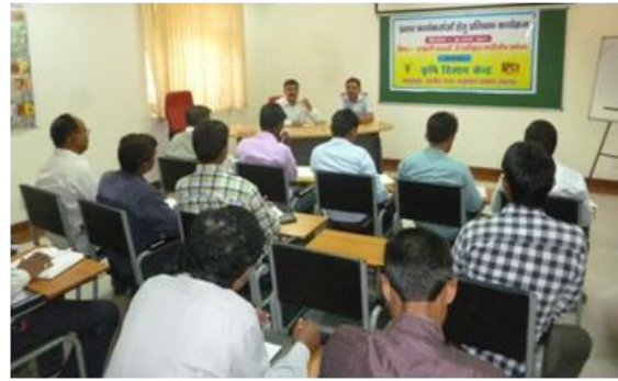
प्रसार कार्यकर्ताओं के लिए आयोजित प्रशिक्षण कार्यक्रम